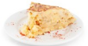
Tortilla clásica de cebolla