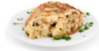
Tortilla de verduras, champiñones, calabacín y cebolla