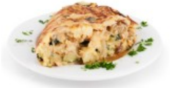
Tortilla de espinacas con cebolla y champiñones