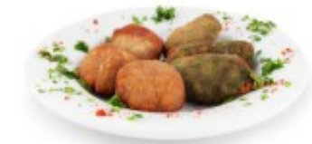
Croquetas caseras de pollo o espinaca